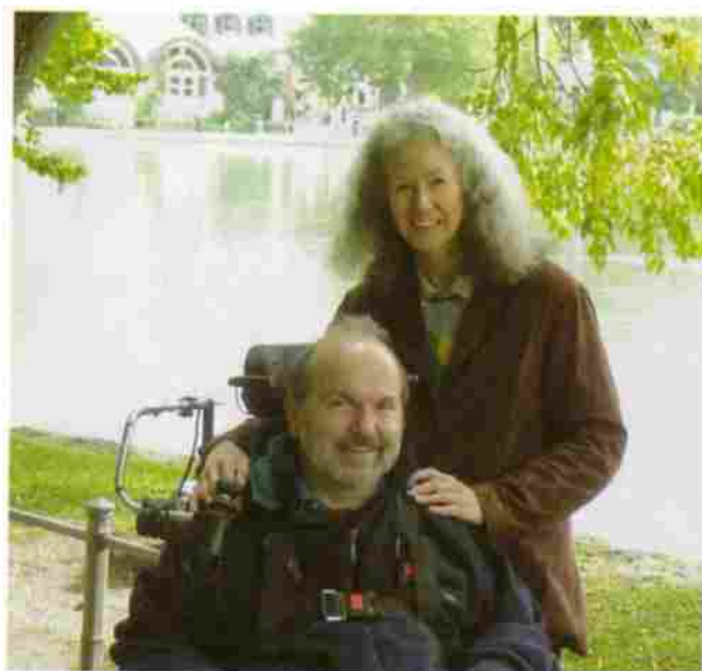
Der Standesbeamte kam zur Hochzeit in die Klinik.

Jeder, der Ähnliches mitgemacht hat, weiß, was danach auf einen zukommt. Es erscheint einem als die Hölle. In den ersten Wochen habe ich das wortwörtlich durchlebt. Ich hatte durch das Trauma und durch die Medikamente große Schwierigkeiten, die Wirklichkeit von meinen Alpträumen zu unterscheiden. Hinzu kam eine schwere Lungenentzündung und dadurch eine MRSA-Infektion. Mehrere Wochen wurde